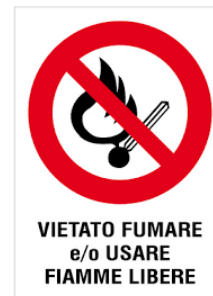
VIETATO FUMARE e/o USARE FIAMME LIBERE

L'incendio è la combustione (reazione chimica di un combustibile con un comburente in presenza di innesco) sufficientemente rapida e non controllata che può svilupparsi senza limitazioni nello spazio e nel tempo. Il rischio di incendio è sempre presente in qualsiasi attività lavorativa.