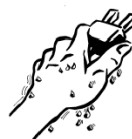
NO MANI BAGNATE